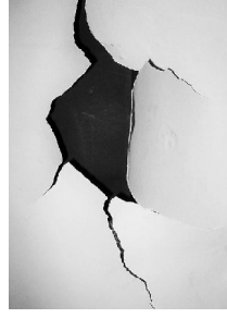
foramine in le muro

calcea vestimento pro le gamba – sete forte desiro de biber qualcosa – cammino via, strata – foramine apertura que da passage – coche carrossa