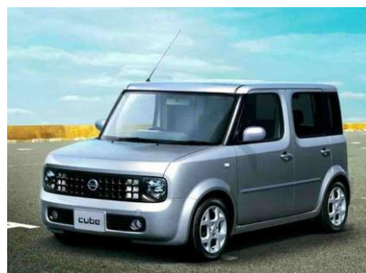
Bertone Carabo (Italia, 1968) e Nissan Cube (Japon, 1998).

Traduction a Interlingua del articulo Carros que fizeram história , per Francisco Alves Filho, publicate in le revista brasilian IstoÉ (15 sept 2010).