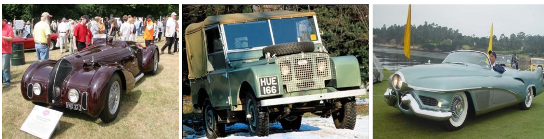
Touring-Bodied Alfa Romeo (Italia, 1938), Land Rover (Regno Unite, 1948) e Buick LeSabre (Statos Unite, 1951)

Cognite como “le auto que motorisava America”, le Ford T es le grande creation de Henry Ford, ben que ille nunquam studiava ingenieria. Originari del campo, ille decideva facer un auto con resistentia pro le stratas rural. Assi, su modello ganiava amortisatores plus resistente e un designo arcate, que terminava conquirante le statouniteses. Le grande levator de iste conquista esseva justemente su forma, que lo differentia del carretas a vapor de alcun decennios antea.