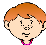
capite de un infante