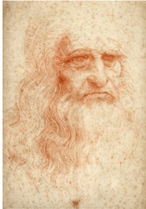
Autoportrait de Leonardo da Vinci in un alte etate