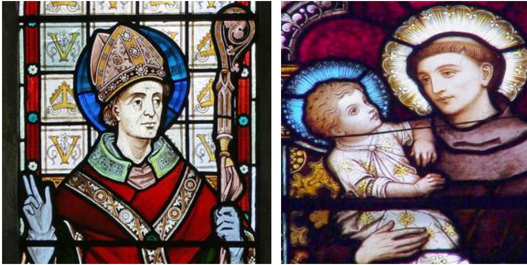
Le sanctos Valentino e Antonio, patronos del inamoratos in differente culturas.

Le celebration hodierna del Die de Sancto Valentino ha su radices in le Lupercalia, festa roman que es parte del rituales de purification realisate tote 15 februario in homage a Lupercus, divinitate lupin equivalente al deo grec Pan, protector del greges e representante del sexualitate masculin. Durante le Lupercalia, homines juvene curreva per le stratas coperte solmente con pelles de capra e flagellava le pueras que illes incontrava in lor cammino con corregias de corio, lo que representava le fecundation del victimas.