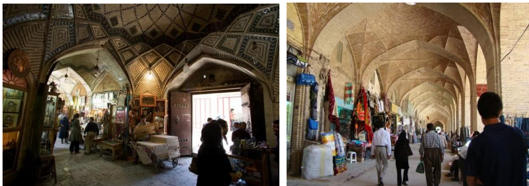
Bazares in le citates Iranian Shiraz e Kerman

Con stratas stricte e labyrinthic, movimento intense e un infinitate de productos a vendita, le bazares es un attraction multo interessante pro visitantes. Situate in le centros ancian del principal agglomeraciones, iste mercatos coperte funciona como un citate intra altere.